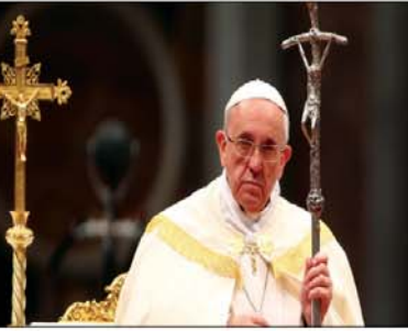
समलैंगिक प्रवृत्ति वाले युवाओं को मरसे में प्रवेश की

(एजेंसी)। पोप ने समलैंगिक लोगों के खिलाफ एक बार फिर बेहद अपमानजनक शब्द का इस्तेमाल किया है, जिसके लिए वह पिछले महीने ही माफी मांग चुके हैं। इतालवी मीडिया ने 20 मई को इतालवी बिशपों के साथ एक बंद कमरे में हुई बैठक के दौरान पोप को «फ्रोसियायिन» शब्द के इस्तेमाल के लिए जिम्मेदार ठहराया था, जो एक अशुभ इतालवी शब्द है जिसका मोटे तौर पर अनुवाद «फगोटनेस» के रूप में किया जाता है। एएनएसएफ के अनुसार, फ्रांसिस ने मंगलवार को रोमन पुजारियों से मुलाकात के दौरान इस शब्द को दोहराया और कहा कि वैटिकन में कट्टरता का माहौल है।