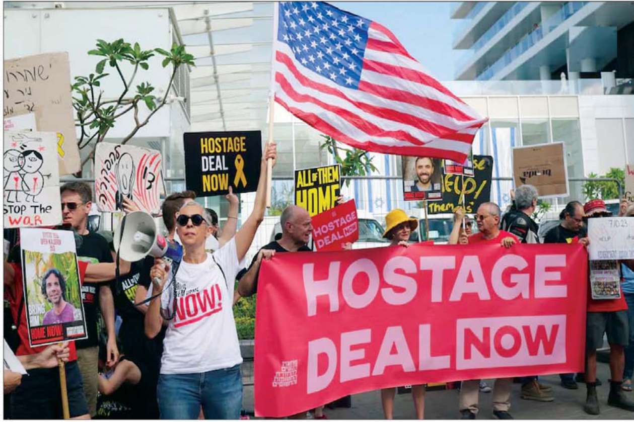
तेल अवीवी में लोग हमारा के हमले में बंधक बनाये गये लोगों को रिहा करने की मांग करते हुए।

स्टॉकहोम। वैज्ञानिकों ने अध्ययन किया है कि वीडियो गेम बच्चों के दिमाग को कैसे प्रभावित करते हैं। शोधकर्ताओं ने दस से 12 वर्ष की आयु के 5,000 से अधिक बच्चों का साक्षात्कार लिया और परीक्षण किया। और वैज्ञानिक रिपोर्ट में प्रकाशित परिणाम कुछ के लिए आश्चर्यजनक होंगे। बच्चों से पूछा गया कि वे दिन में कितने घंटे सोशल मीडिया पर, वीडियो या टीवी देखने और वीडियो गेम खेलने में बिताते हैं। जवाब था- बहुत घंटे। औसतन, बच्चे दिन में दार्ड घंटे ऑनलाइन वीडियो या टीवी कार्यक्रम देखने में, आधा घंटा ऑनलाइन सोशललाइजेशन और एक घंटा वीडियो गेम खेलने में बिताते हैं। यह समय कुल मिलाकर, औसत बच्चे के लिए दिन में चार घंटे और शीर्ष 25 प्रतिशत के लिए छह घंटे - बच्चे के खाली समय का एक बड़ा हिस्सा था। और अन्य रिपोर्टों में पाया गया कि यह दशकों में नाटकीय रूप से बढ़ा है। पिछली पीढ़ियों में स्क्रीन आसपास तो थे, लेकिन अब यह वास्तव में बच्चों की जीवन का हिस्सा बन गए हैं। क्या यह एक बुरी बात है? खैर, यह जटिल है। बच्चों के विकासशील दिमाग के लिए फायदे और नुकसान दोनों हो सकते हैं। और ये उस परिणाम पर निर्भर हो सकते हैं जिसे आप देख रहे हैं। हमारे अध्ययन में, हम विशेष रूप से बुद्धि पर स्क्रीन टाइम के प्रभाव में रुचि रखते थे - प्रभावी ढंग से सीखने, तर्कसंगत रूप से सोचने, जटिल विचारों को समझने और नई परिस्थितियों के अनुकूल होने की क्षमता। बुद्धिमान हमारे जीवन का एक महत्वपूर्ण गुण है और बच्चे के भविष्य की आय, खुशी और लंबी उम्र का आधार भी है। अनुसंधान में, इसे अवसर संचालनात्मक परीक्षणों की एक विस्तृत श्रृंखला पर प्रदर्शन के रूप में मापा जाता है।