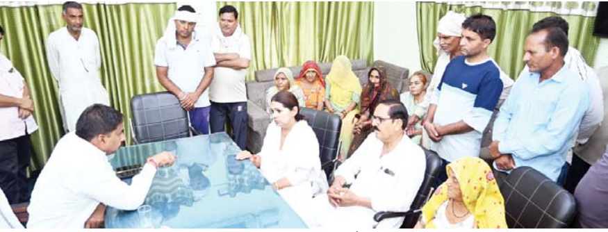
तेज. रिपोर्टर | हनुमानगढ़

सभापति से मिले वार्डवासी, स्वीकृति निरस्त करने की मांग