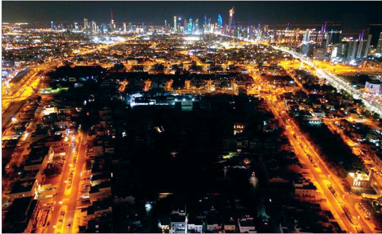
कुवैत में बिजली की कमी के कारण कई इलाके अंधेरे में डूबे नजर आ रहे। यहां गर्मी बढ़ने के साथ ही बिजली की मांग बढ़ने के बाद ग्रिड पर दबाव काफी बढ़ गया है।