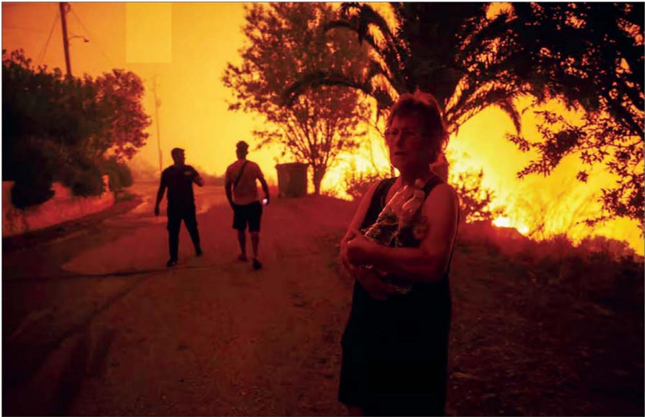
दक्षिणी ग्रीस के लतास गांव में जल रही जंगल की आग के बगल में एक स्थानीय निवासी पानी की बोटलें पकड़े हुए।