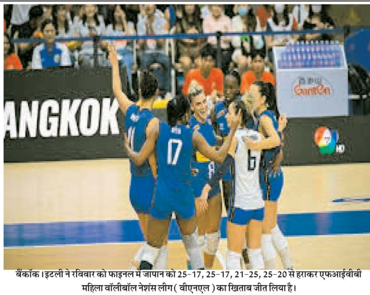
बैंकॉक। इटली ने रविवार को फाइनल में जापान को 25-17, 25-17, 21-25, 25-20 से हराकर एफआईवीबी महिला वॉलीबॉल नेशंस लीग (वीएनएल) का खिताब जीत लिया है।