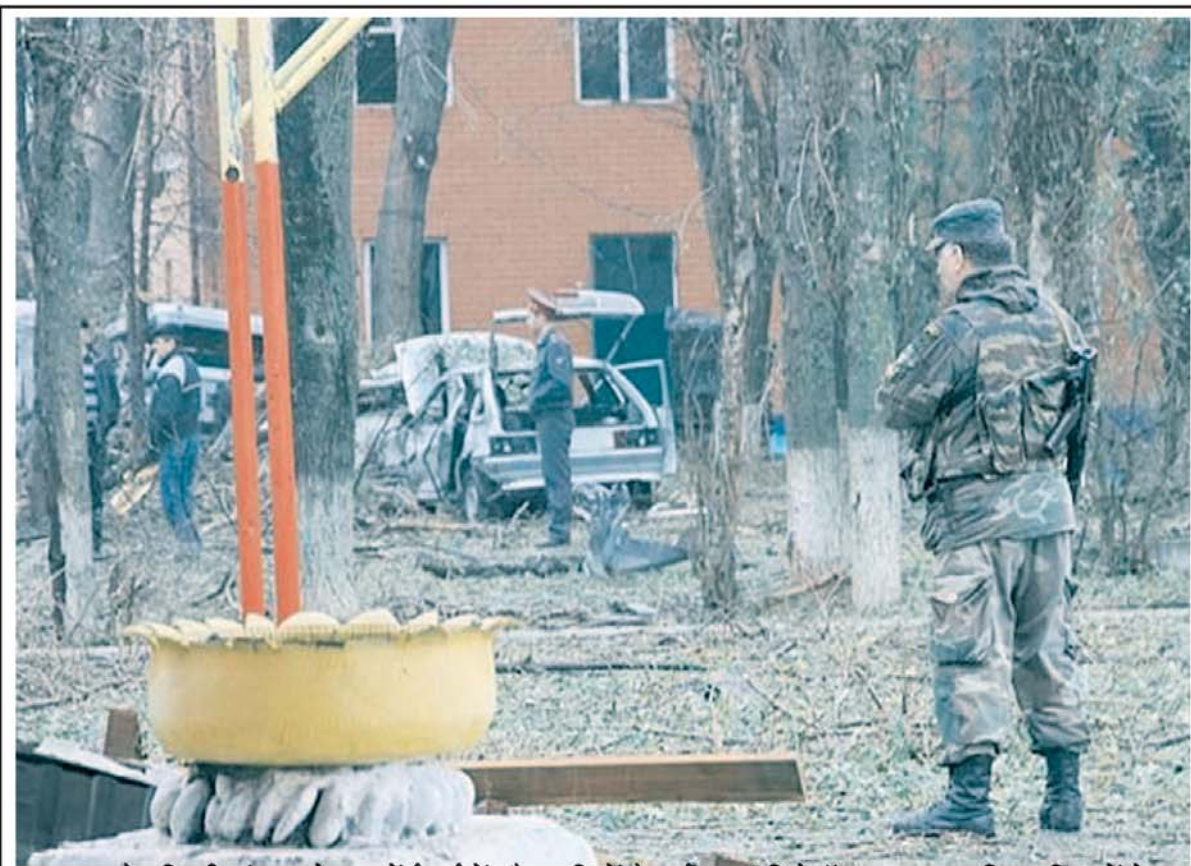
रूस के दक्षिणी प्रांत-दागैस्तान में ईसाईयों और यहूदियों के धर्मस्थल (सिनगॉग) पर अत्याधुनिक हथियारों से अंधाधुंध गोलीबारी करते हुए सैनिक