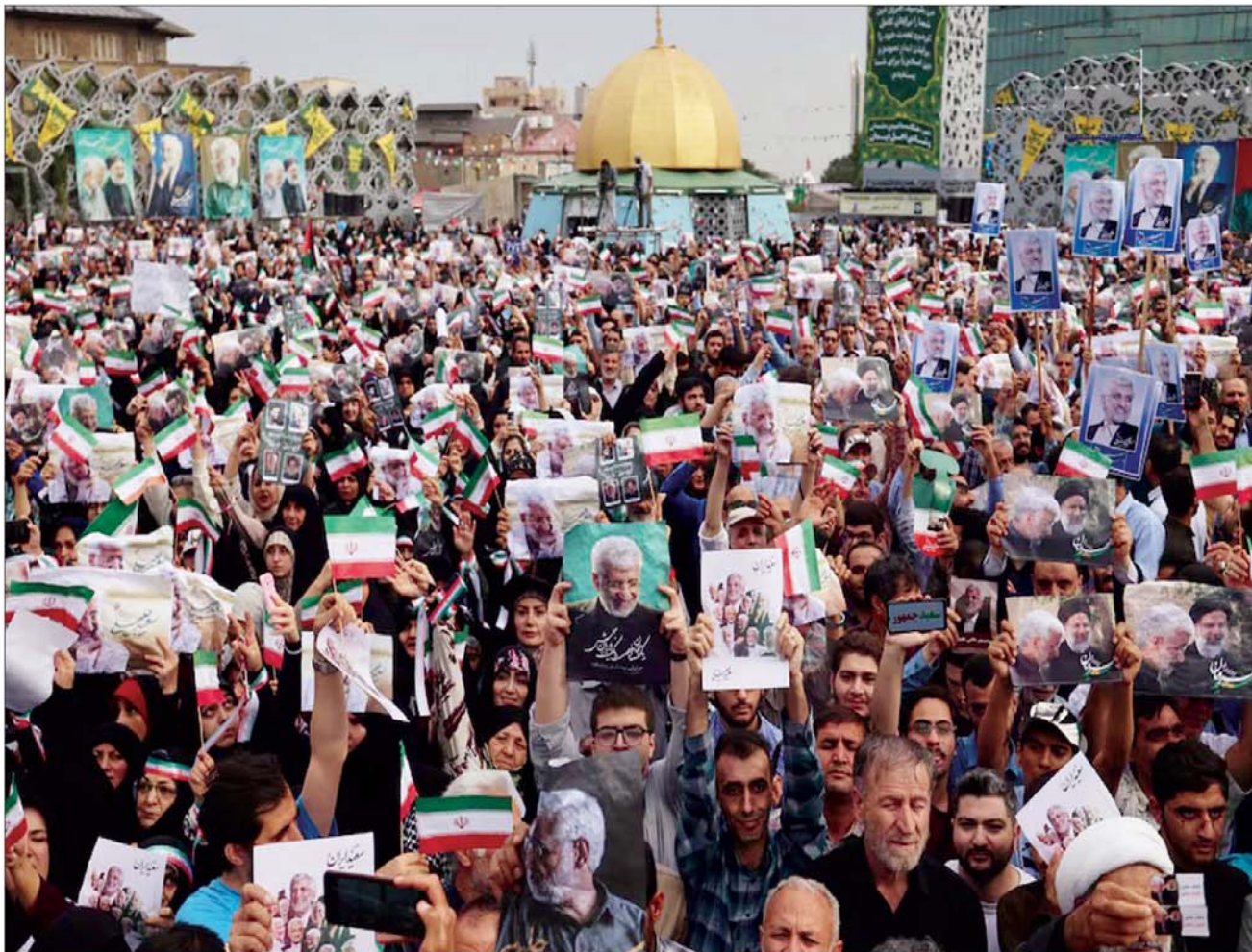
तेहरान में राष्ट्रपति पद के उम्मीदवार सईद जलीली के समर्थक चुनाव अभियान के दौरान उमड़ पड़े।

कीव। रूस और यूक्रेन के बीच जारी युद्ध के बीच स्पेन ने यूक्रेन को पैट्रियट एंटी-एयरक्राफ्ट मिसाइलों के दूसरी खेप की आपूर्ति कर दी है। रिपोर्ट के अनुसार मिसाइलों के दूसरे बैच की आपूर्ति 21 जून को की गई। मिसाइलों के अलावा, शिपमेंट में लियोपार्ड टैंक, विभिन्न प्रकार के गोला-बारूद, एंटी-ड्रोन सिस्टम, ऑप्टिकल-इलेक्ट्रॉनिक निगरानी प्रणाली और रिमोट-नियंत्रित बर्ज शामिल हैं। रिपोर्ट में कहा कि मई के अंत में यूक्रेनी राष्ट्रपति वोलोडिमिर जेलेंस्की और स्पेन के प्रधानमंत्री पेद्रो सांचेज ने स्पेन की राजधानी मैड्रिड में एक द्विपक्षीय सुरक्षा समझौते पर हस्ताक्षर किए।